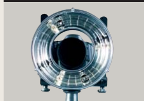
RF 3000 P/PM-XS | RF 3000 XS