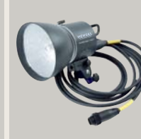
EH PRO MINI 1200 PORTY HEAD