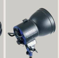
EH PRO MINI SPEED HEAD