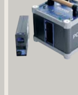
PORTY 1200 B PORTY PREMIUM PLUS