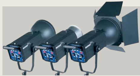
MONO MAX 750 | 1000 | 3000