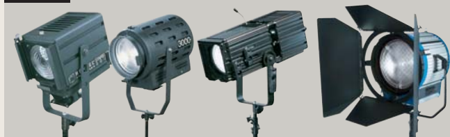
STARSPOT 1500 PORTY | FRESNELSPOT 3000 | WEITWINKEL SUPER SPOT 3000 | 6000 | F-SPOT 3000 STARSPOT 3000 | FRESNELSPOT 6000 | WIDE ANGLE SUPER SPOT 3000 | 6000