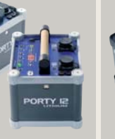
PORTY 6 LITHIUM | PORTY 12 LITHIUM