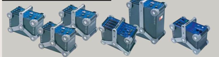
TRIA 1500 SPEED | 1500 S | 3000 S | 3000 AS | 6000 S