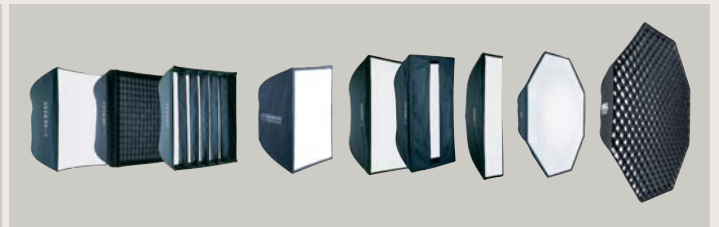
SOFTBOXEN & ZUBEHÖR // SOFTBOXES & ACCESSORIES