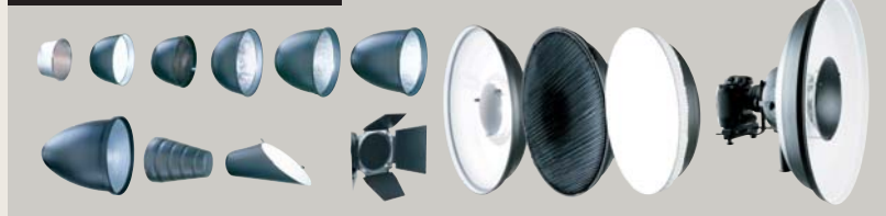
REFLEKTOREN | WABEN | FLÜGELTORE // REFLECTORS | HONEYCOMBS | BARN DOORS