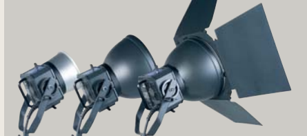
MH HEAD 3000 | 3000 SPEED | 6000