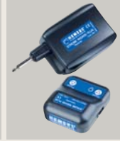
STROBE WIZARD PLUS