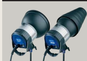
EH PRO HEAD | EH PRO HEAD 6000