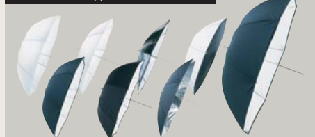
SCHIRME // UMBRELLAS