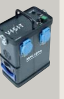
VISIT MPG 1500