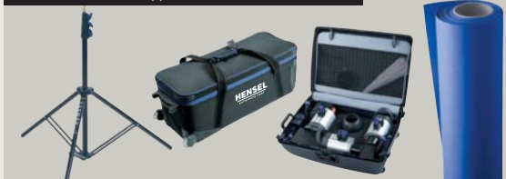
STATIVE | TASCHEN | HINTERGRÜNDE // STANDS | CASES | BACKGROUNDS