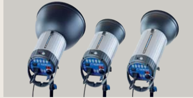
EXPERT PRO (INTEGRA) PLUS 250 | PLUS 500 | PLUS 1000