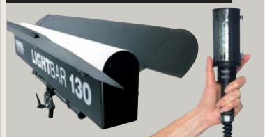
LIGHTBAR 130 | LIGHTSTICK