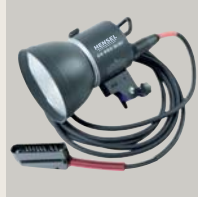
EH PRO MINI HEAD